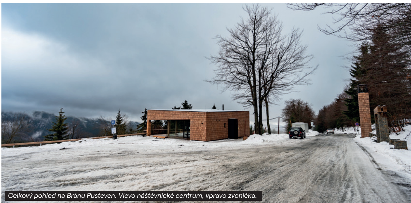
Celkový pohled na Bránu Pustevn. Vlevo nástěvnícké centrum, vpravo zvonička.