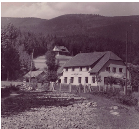
Hotel Kněhyně ještě s kamenitou cestou

pracoval jako provozní a číšník, manželka jako kuchařka. Věhlas hotelu pokračoval, i když pod jiným majitelem, ale za vedení rodiny Skokanovy. V polovině šedesátých let se manželství Skokanových rozpadá a oba hotel opouštějí.