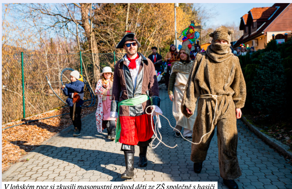
V loňském roce si zkusili masopustní průvod děti ze ZŠ společně s hasiči