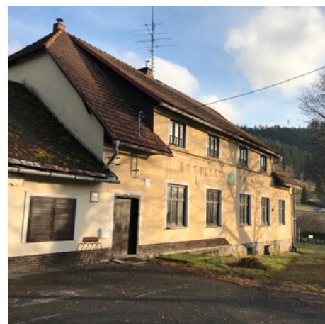
Současný stav - rok 2023