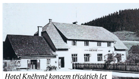
Hotel Kněhyně koncem třicátých let