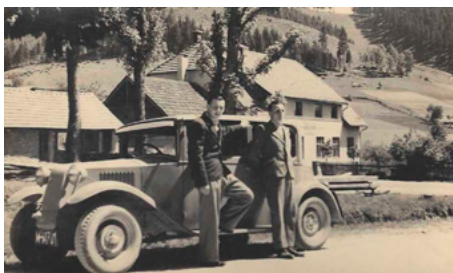
Hotel Skokan v třicátých letech 20. století

Hotel prosperoval, během druhé světové války se zde často stahovali partyzáni a pan Skokan je zásoboval jídlem a vším, co jim mohl poskytnout.