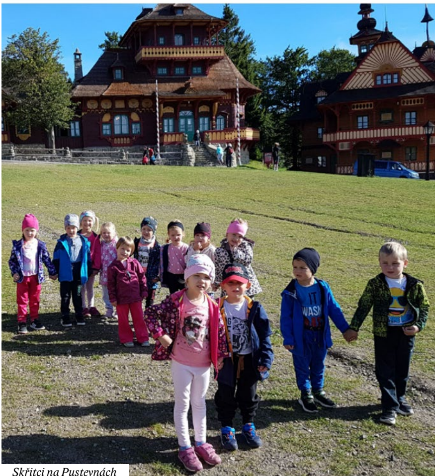
Skřítci na Pustevnách

a posbírali první bylinkovou úrodu, která nám teď krásně voní ve třídě. Bylinky využijeme především v zimních měsících. Práce na zahradě děti moc baví - vytrhávají plevel, učí se pracovat s nářadím - hrabou listí a hlínu, ryjí a okopávají. Přírodní prvky naší zahrady byly spolufinancovány Státním fondem životního prostředí České republiky na základě rozhodnutí ministerstva životního prostředí částkou 500 000,- Kč ( www.sfzp.gov.cz ).