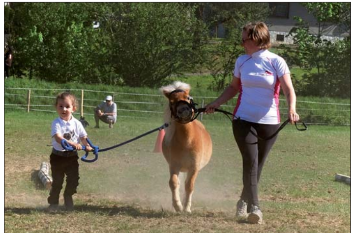
Na výstavě vystavovaly i nejmenší děti.