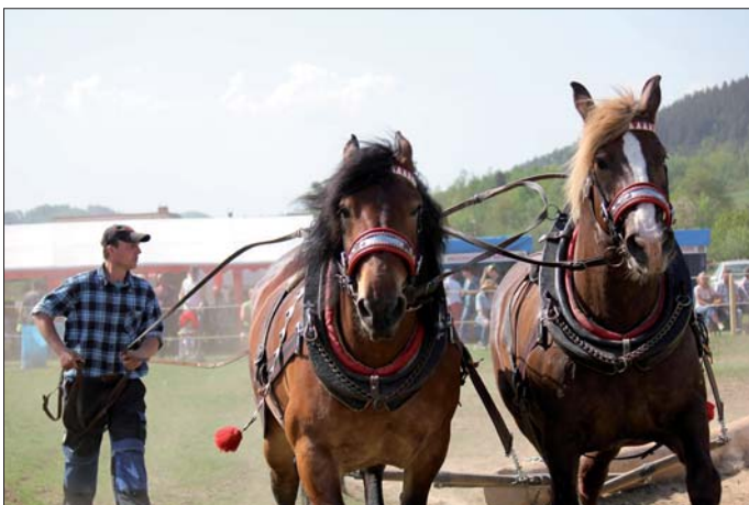
Soutěž chladnokrevných koní.