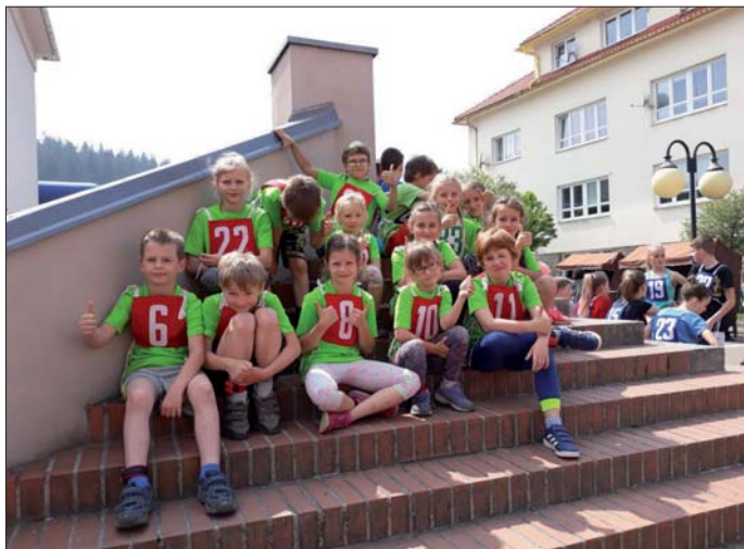
Malí atleti - Macurův memoriál.

Na konci dubna se 36 žáků naší školy zúčastnilo atletických závodů „Memoriál Cyrila Macha“ na Hutisku. Soutěžilo se v běhu na 50 a 400 m, v hodu kriketovým míčkem a skoku dalekém. Projevila se zde velká bojovnost i soudržnost dětí a díky fyzické zdatnosti, která je rozvíjena i zásluhou hasičských tréninků, naši atleti získali krásných 26 medailí (8 zlatých, 11 stříbrných a 7 bronzových). Na další tradiční soutěž v běhu „Macurův memoriál“ na Horní Bečvě bylo vybráno 14 sportovců. I ti nám vybojovali 4 medaile (2 zlaté, 1 stříbrnou a 1 bronzovou).