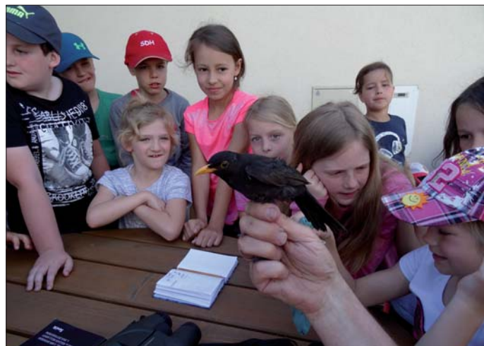
Návštěva Valašského ekocentra.

oobjivelníci, naučili se poznávat běžné druhy ptáků, hrou zjistili, čím mohou ptactvo přikrmovat a rozeznávali ptačí vajíčka. Seznámili se i s různými druhy krmítek a budek, do jedné z nich nakoukli na zrovna narozená mláďátka. Nejvíce je zaujalo kroužkování odchycených ptáků, které si mohli následně sami vypustit do přírody. Vyrobili si čápa z papíru a nakonec se prošli naučnou stezkou kolem nedalekého rybníka, kde pozorovali užovku a vodní hmyz.