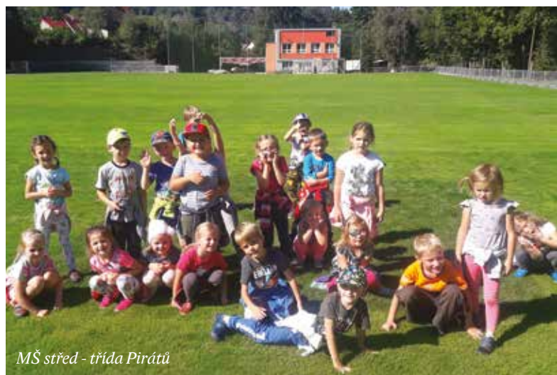
MŠ střed - třída Pirátů