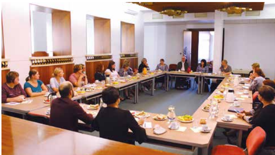
V září proběhlo setkání poskytovatelů služeb

V Mikroregionu Rožnovsko funguje sdílené financování sociálních služeb. Všechny obce Mikroregionu (kromě Vigantic a Zubří, které řeší financování samostatně) přispívají 100 Kč na obyvatele do společného fondu. U Prostřední Bečvy se jedná ročně o 174 tis. Kč. Grantová komise na začátku roku vyhodnotí žádosti a prostředky přerozdělí. V letošním roce se jednalo o téměř 5,5 mil. Kč. Nejvyšší částkou byla podpořena Pečovatelská služba Charity (1,641 mil.), denní stacionář Radost pro seniory a hůř pohyblivé občany (466 tis. Kč), Kamarád – sociálně terapeutická dílna pro osoby se sníženou soběstačností (444 tis. Kč.) a další. Na společném setkání všichni poskytovatelé představili své služby a náplň je skutečně pestrá. Od Domova seniorů, různých ambulantních i terénních služeb pro seniory, přes pomoc dětem se zdravotním hendikepem, podpora pěstounů, služby pro duševně nemocné, až po bezdomovce nebo osoby, které