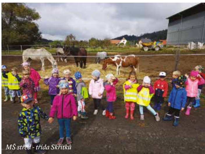
MŠ střed - třída Skřítků