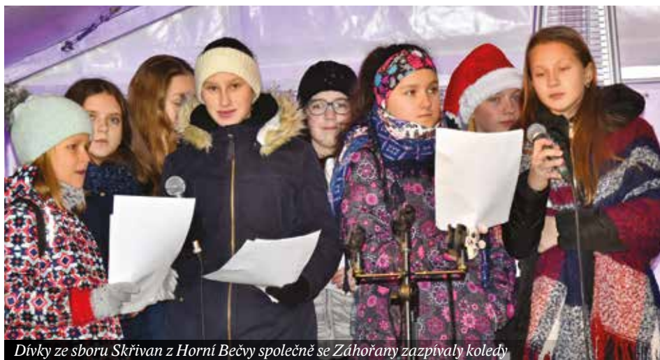
Dívky ze sboru Skřivan z Horní Bečvy společně se Záhořany zazpívaly koledy