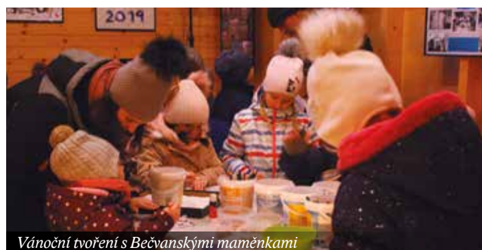
Vánoční tvoření s Bečvanskými maměnkami