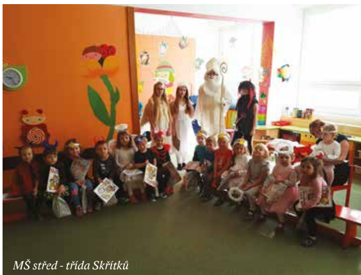
MŠ střed - třída Skřítků