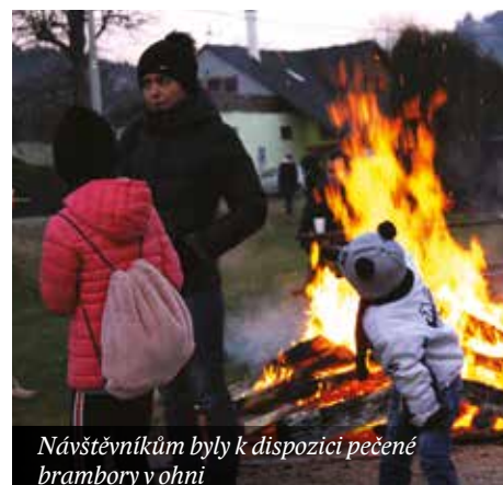
Návštěvníkům byly k dispozici pečené brambory v ohni