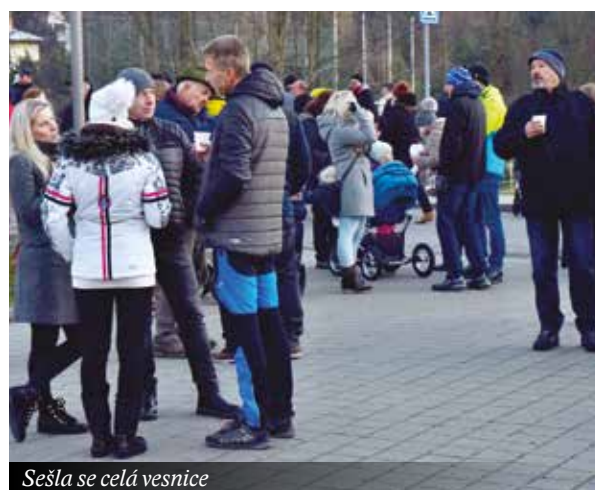
Sešla se celá vesnice