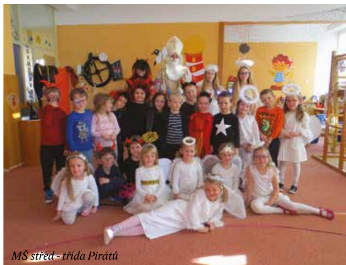
MŠ střed - třída Pirátů

„ Přišel k nám čert s Mikulášem, přišel nikým neohlášen, zazvonil a povídal, že by se rád podíval. Všichni jsme se radovali, taky jsme mu zazpívali, ať přinese zimní čas, a příští rok přijde zas.“