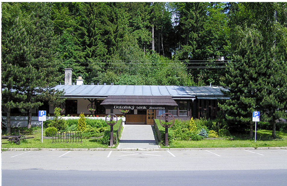
Na fotografii Valašský šenk v roce 2004.