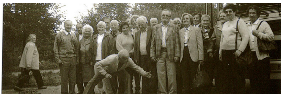
Nejstarší foto důchodců.

posezení při guláši a v říjnu se koná výroční schůze klubu. Na všech těchto akcích je bohaté občerstvení a často i hudba k tanci a poslechu.