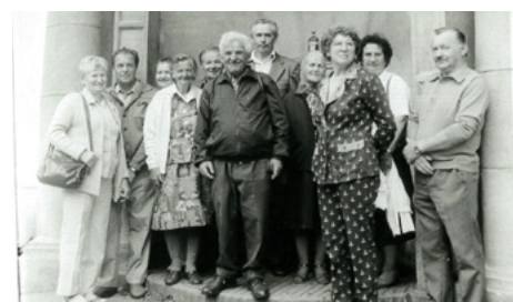
Zájezd kolem roku 1990.