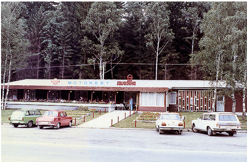
Pohled na původní Motorest Zavadilka.