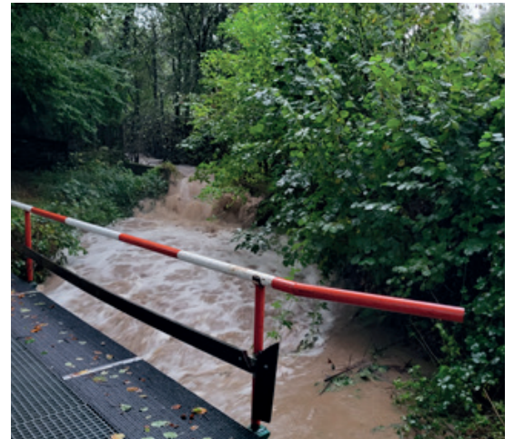
Bezejmenný potok, který teče z Adámek a vlévá se do Bečvy.