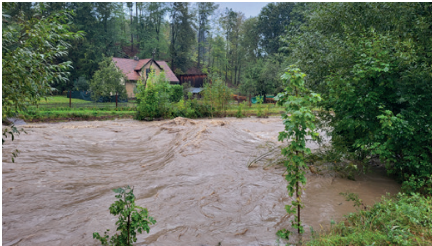
Bečva na dolním konci v neděli ráno.