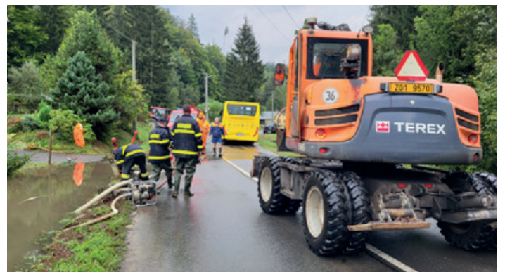
Čištění propustku u cesty na Pustevny.