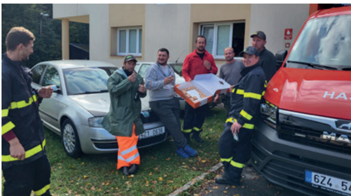
Chvilka odpočinku pro hasiče.