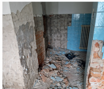
Rekonstrukce přípravný jídlá v MŠ Kněhyně.

a výstavbu nové - stejný nebo odlišný vzhled. Je ukončen výběr dodavatele popelnic na tříděný odpad. Více o akci na straně 4. Nové webové stránky obce – máme vybranou firmu, řešíme design. Získali jsme 70% dotaci na provoz informačního centra Brána Pustevn, za kterou pořídíme 2x skříň do íčka, 2x skříň do skladu, dotykovou pokladnu a školení. Ze Zlínského kraje jsme získali 50% dotaci na kulturní aktivity „Letní náves“, které proběhly v prázdninových měsících (divadla pro děti, koncerty, deskohraní apod.).