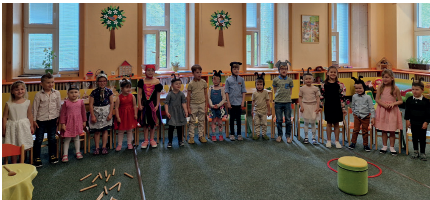
Besídka dětí z Kněhyň

se podívat k řece Kněhyni, kde pozorovaly čistou vodu, povídaly si o důležitosti vody pro život na naší planetě, o znečišťování vodních toků. Děti si hodily klacík nebo šišku do vody – povídaly si, kam mohou doplnout, jestlipak doplují až do moře? Následující den se děti vypravily ke kontejnerům na třídění odpad. Dozvěděly se, jak třídit odpad, jakou mají kontejnery barvu, kam tříděný odpad putuje