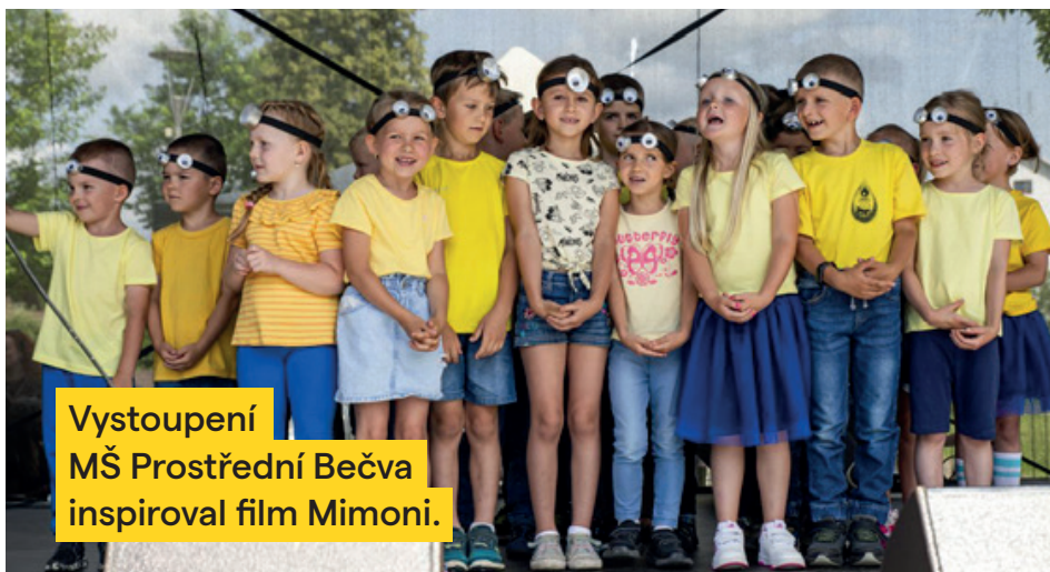
Vystoupení MŠ Prostřední Bečva inspiroval film Mimoni.