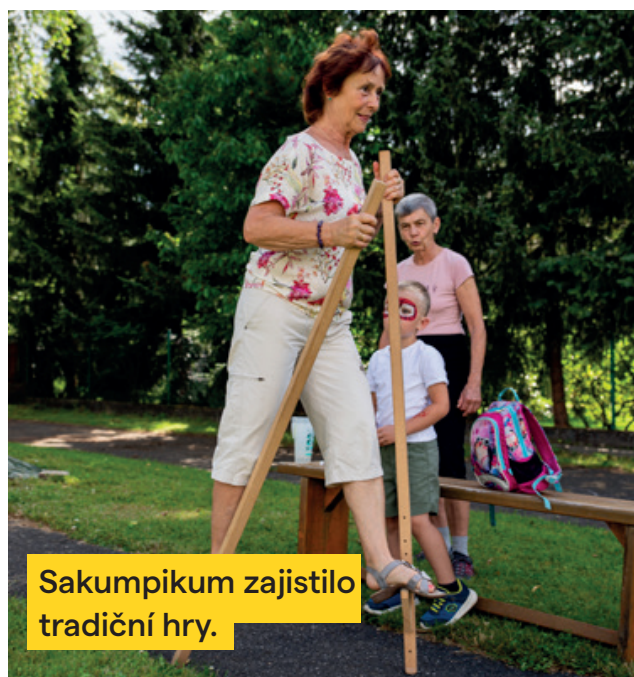
Sakumpikum zajistilo tradiční hry.