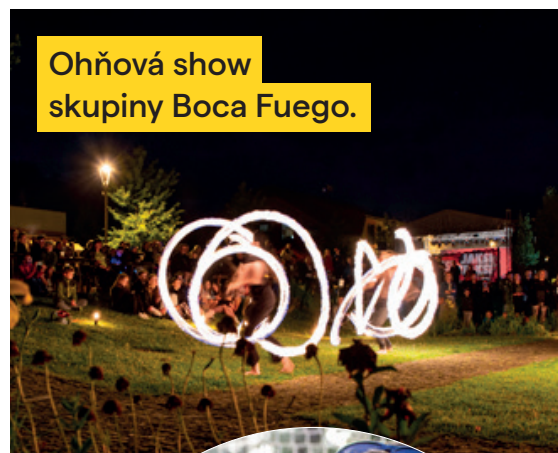
Ohňová show skupiny Boca Fuego.