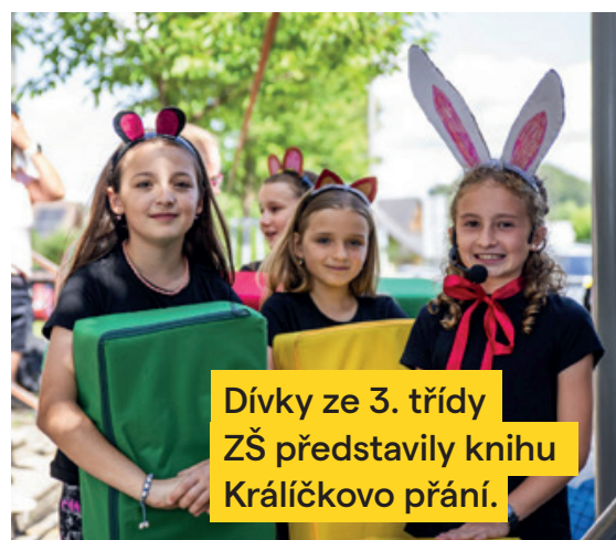
Dívky ze 3. třídy ZŠ představily knihu Králíčkovo přání.