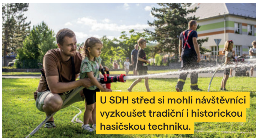
U SDH střed si mohli návštěvníci vyzkoušet tradiční i historickou hasičskou techniku.